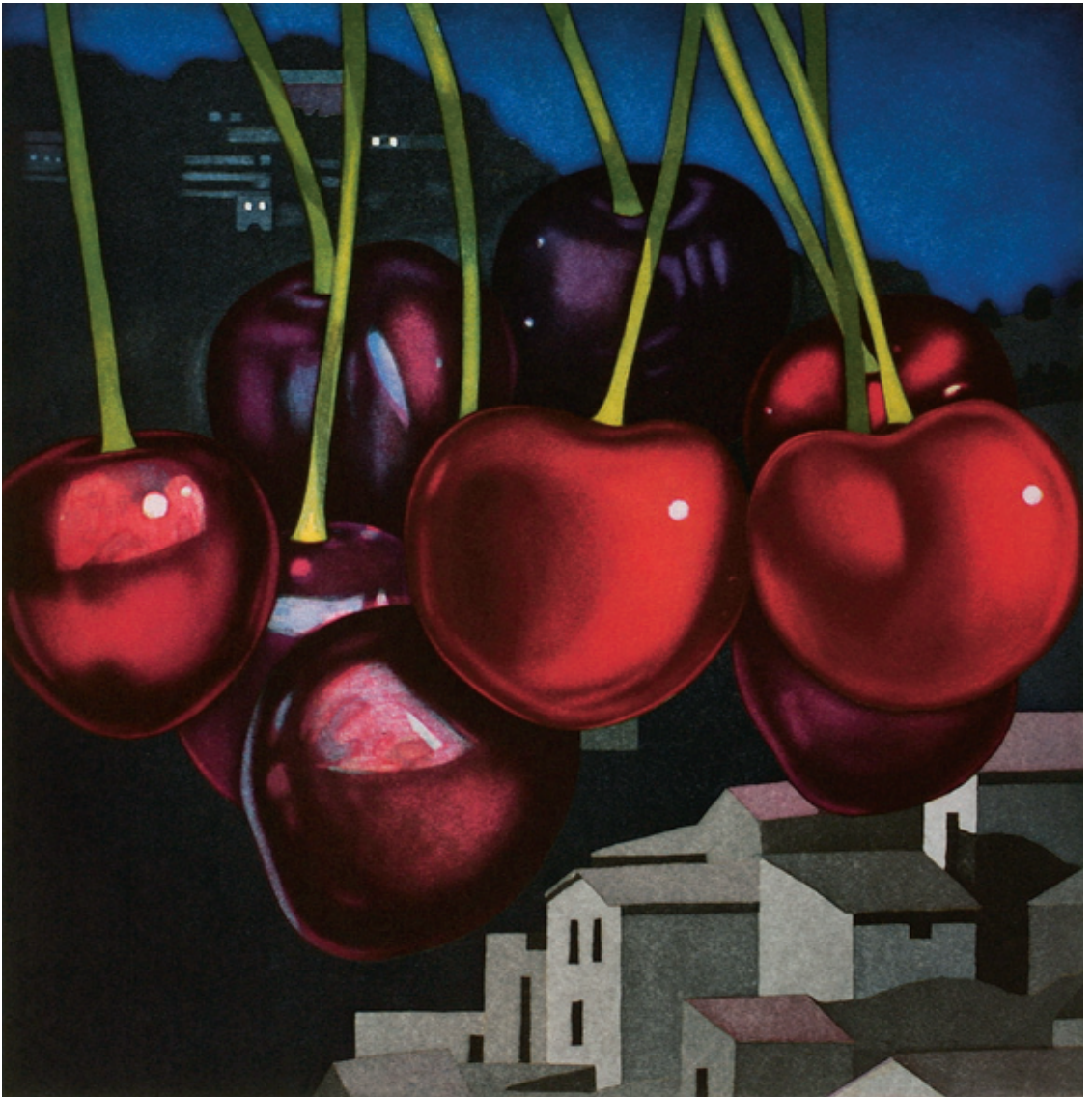
Kirschen 2005 / Original-Radierung in fünf Farben / 60 x 60 cm / Papier: Zerkall-Bütten 78 x 76 cm / Auflage 90 Ex. / arabisch nummeriert und signiert