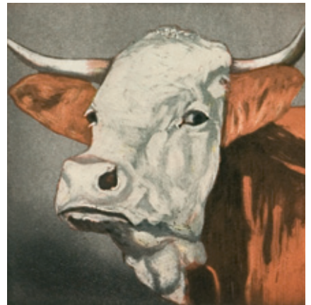
S. 8 und 9 Tierköpfe 2005 / jeweils Original-Radierung in drei oder vier Farben / 20 x 20 cm / Papier: Zerkall-Bütten 38 x 36 cm / Auflage 90 Ex. / arabisch nummeriert und signiert