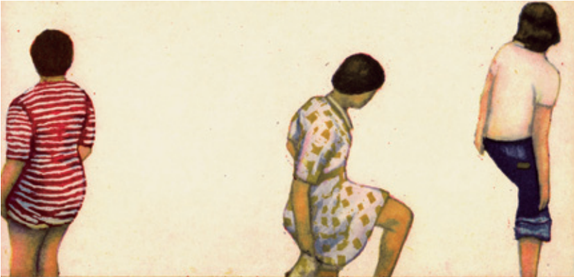
Interieur 2006 / Original-Radierung in drei Farben / 15 x 21 cm / Papier: Zerkall-Bütten 22 x 29 cm / Auflage 150 Ex., nummeriert und signiert Menschen 2006 / Original-Radierung in drei Farben / 10 x 20 cm / Papier: Zerkall-Bütten 22 x 29 cm / Auflage 150 Ex. / nummeriert und signiert