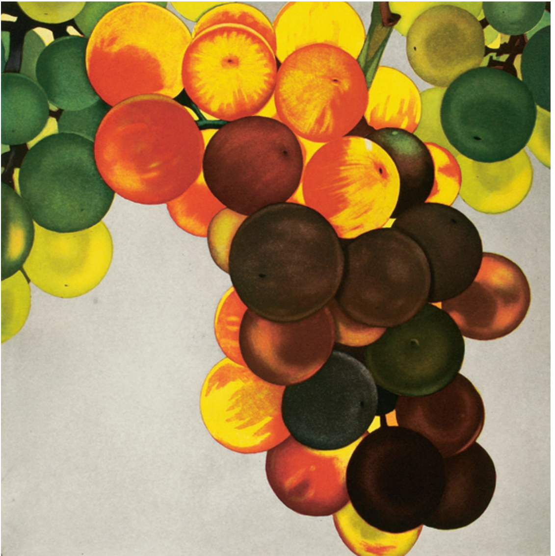
Trauben 2005 / Original-Radierung in fünf Farben / 60 x 60 cm / Papier: Zerkall-Bütten 78 x 76 cm / Auflage 90 Ex. / arabisch nummeriert und signiert