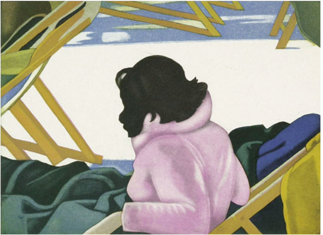
Im Liegestuhl 2005 / Original-Radierung in vier Farben / 31,5 x 41,5 cm / Papier: Zerkall-Bütten 50 x 60 cm / Auflage 75 Ex. / nummeriert und signiert