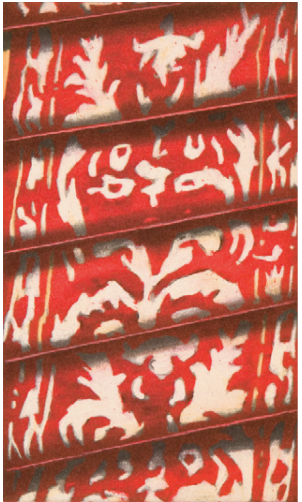
Roter Teppich 2006 / Original-Radierung in drei Farben / 30 x 18 cm / Papier: Zerkall-Bütten 48 x 34 cm / Auflage 50 Ex. / nummeriert und signiert