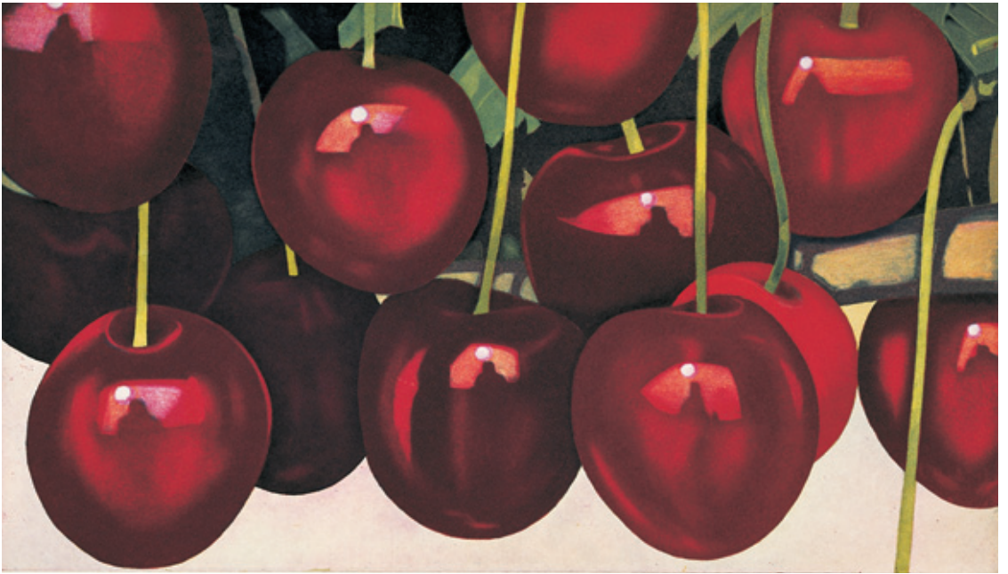
Kirschen 2004 / Original-Radierung in vier Farben / 34,5 x 60 cm / Papier: Zerkall-Bütten 57 x 80 cm / Auflage 75 Ex. / nummeriert und signiert